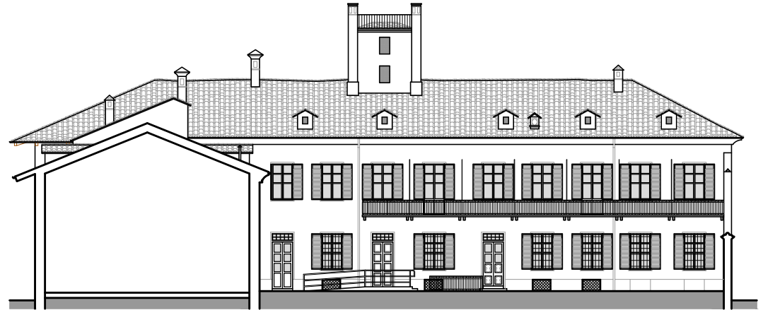
Prospetto su cortile - scala 1:100