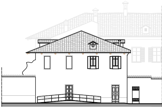
Prospetto su Via Fossati - scala 1:100